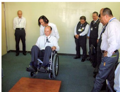
ユニバーサルドライバー研修の一コマ。歩道の縁石を想定した段差の乗り越えの訓練です。

私たちは、お年寄りの方、認知症の方、肢体不自由な方、目や耳の不自由な方、知的障がいや精神障がいのある方など、すべての人々が同じ社会で共に暮らすことを理想としています。そのためにタクシーが果たす役割は何か。あらゆるお客様の理解と対応できる乗務員を育成することが、私たちの社会的責任と考えます。そのために、ハード面ではユニバーサルデザイン車両の運行、ソフト面では従来の介護タクシーに加え、ユニバーサルドライバー研修の修了者を一般タクシーに乗務させることを進めています。